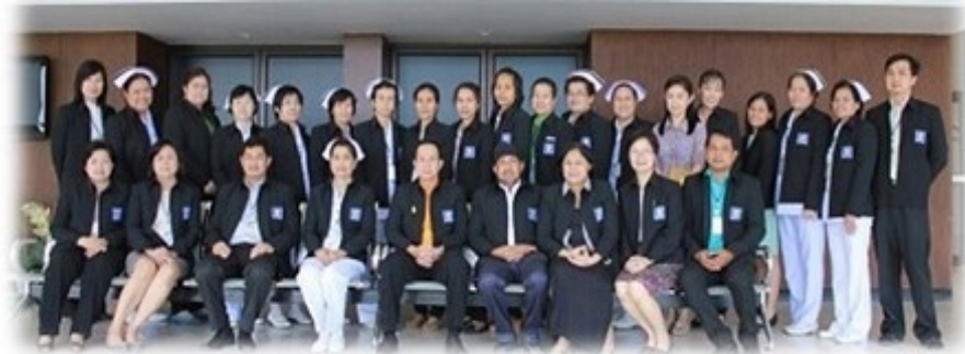
คณะกรรมการบริหารโรงพยาบาลบางพลี